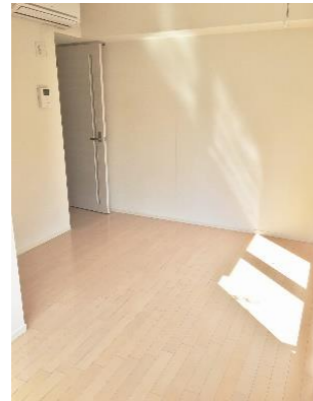
※写真は他のお部屋です。